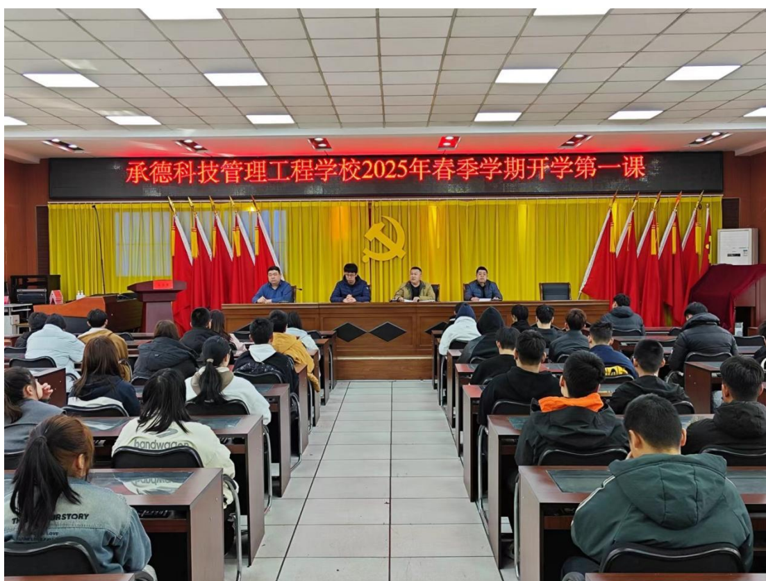
图片 11：开学安全第一课

面面内容，引导学生牢固树立安全意识。衔接“开学安全第一课”，学保科、总务科、教务科三位科长，利用通俗易懂的语言分别为全体学生讲解了教育部门及学校对防溺水、防欺凌、食品安全、实训室安全等方面的各项要求。开学初是安全事故易发阶段，学校结合当前社会安全形势及学生年龄特点，聚焦校园安全，旨在通过“安全第一课”帮助学生树立安全意识、掌握自护技能，为全年校园安全工作奠定基础。通过本次活动，让安全理念在每位师生心中扎根，为打造平安、健康、和谐的校园环境奠定了坚实基础。