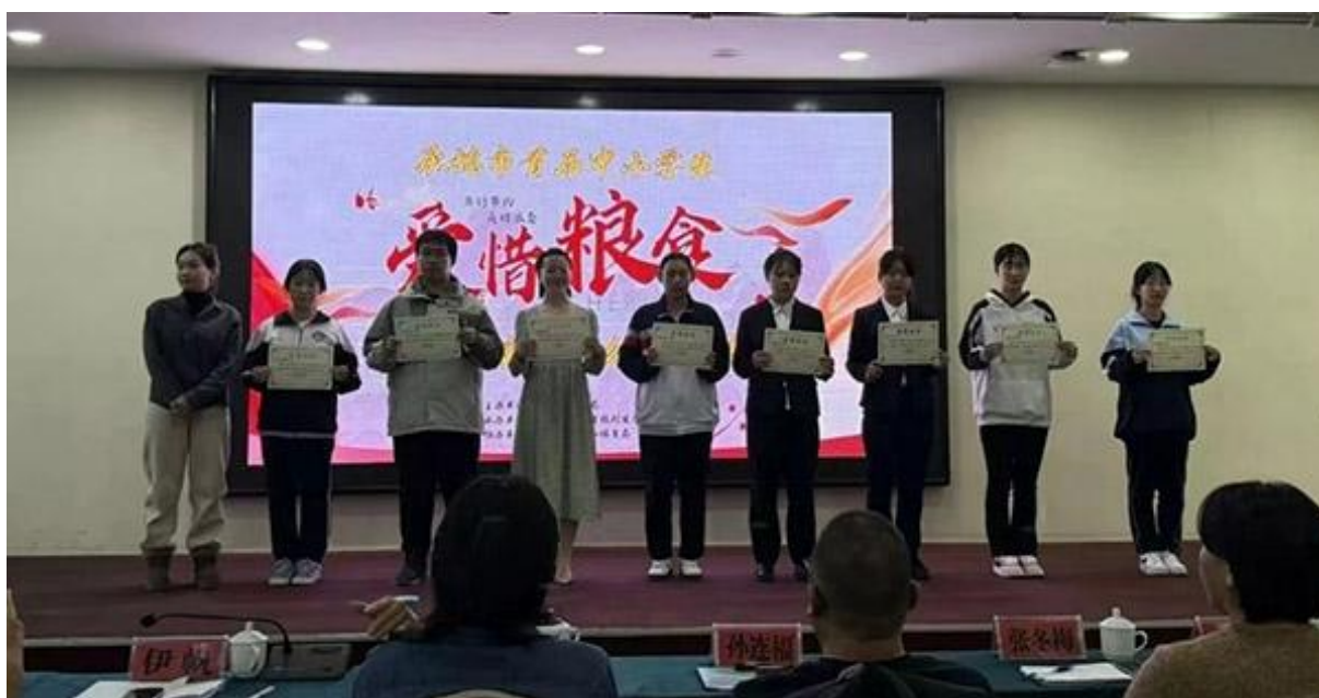
图片 10：演讲比赛获奖

探讨合理用餐、健康饮食和如何避免浪费等实际问题，明白浪费是对资源的不珍惜。同时通过现场演讲形式，树立了廉洁自律的榜样，引导学生在生活中自觉抵制浪费和不良行为，为建设节约型社会贡献力量。我校将继续切实开展“爱粮节粮 从我做起”系列活动，认真贯彻落实总书记关于制止餐饮浪费行为的重要指示精神，大力弘扬中华民族勤俭节约、艰苦奋斗的优良传统，教育引导广大青少年牢固树立节约意识，积极营造厉行节约、反对浪费的良好氛围。