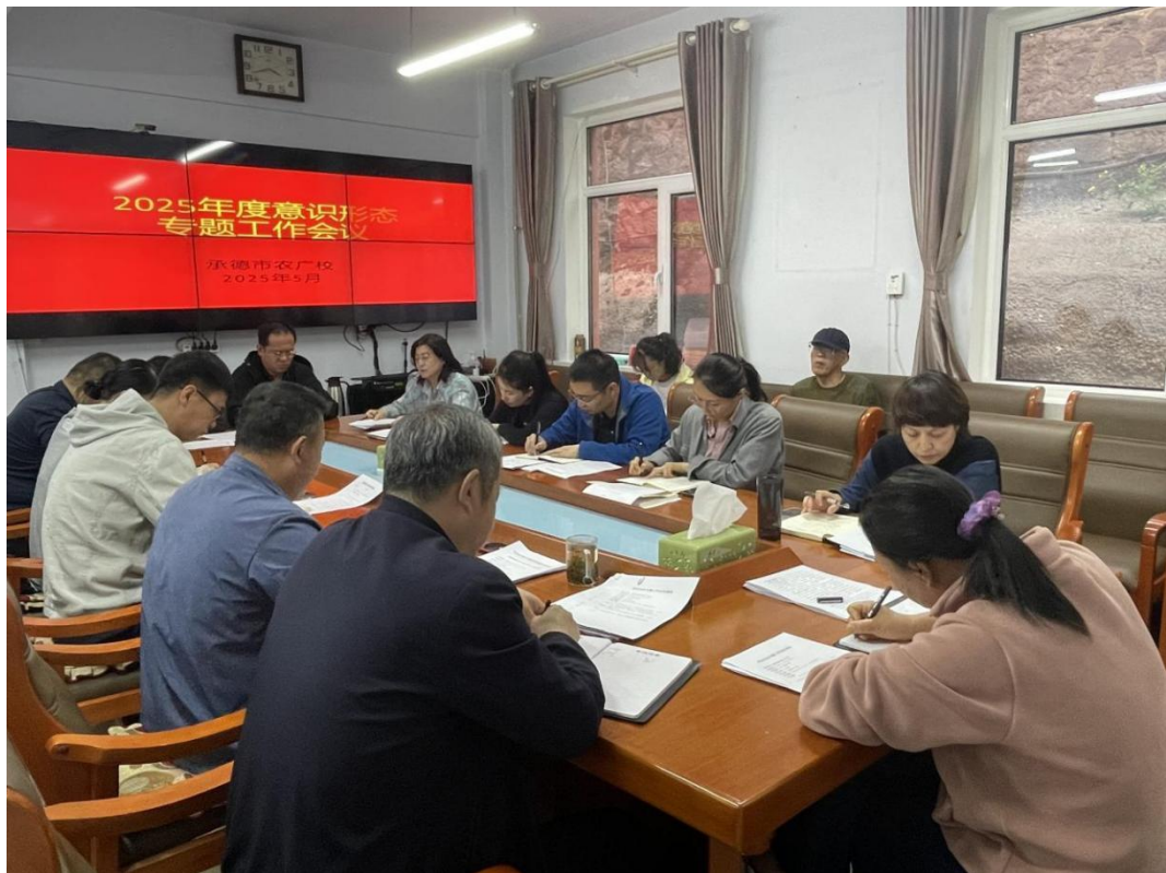
图片 2：意识形态工作会议